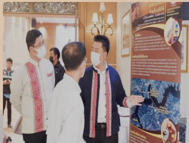
ผู้เข้าร่วมประชุมเยี่ยมชมบอร์ดนิทรรศการ