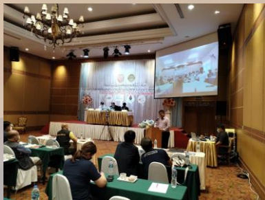
ภาพบรรยากาศภายในห้องประชุม