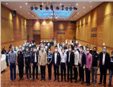
การถ่ายภาพร่วมกัน