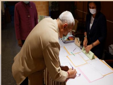
การลงทะเบียนและรับเอกสาร

กรมทางหลวงร่วมกับกลุ่มบริษัทที่ปรึกษาได้จัดการประชุมปฐมนิเทศโครงการ (สัมมนา ครั้งที่ 1) โครงการสำรวจและออกแบบสะพานปากนายข้ามเขื่อนสิริกิติ์ อ.น้ำปาด จ.อุตรดิตถ์ - อ.นาหมื่น จ.น่าน เพื่อนำเสนอข้อมูลรายละเอียดโครงการให้กลุ่มเป้าหมายได้รับทราบและร่วมให้ข้อคิดเห็นและข้อเสนอแนะต่อโครงการ เมื่อวันที่ 7 มีนาคม 2566 เวลา 13.00-16.30 น. ณ ห้องแกรนด์บอลรูม 2 โรงแรมทเวราช อำเภอเมือง จังหวัดน่าน และการประชุมทางไกลผ่านโปรแกรม Zoom Cloud Meetings ผู้เข้าร่วมประชุม ประกอบด้วย ผู้แทนจากหน่วยงานราชการระดับต่าง ๆ หน่วยงานรัฐวิสาหกิจ องค์กรปกครองส่วนท้องถิ่น องค์กรพัฒนาเอกชน ผู้นำชุมชน ศาสนสถาน ผู้ประกอบการ สื่อมวลชน และประชาชนทั่วไป รวมถึงผู้แทนกรมทางหลวง และบริษัทที่ปรึกษา รวมทั้งสิ้น 253 คน ซึ่งผู้เข้าร่วมประชุมได้ร่วมกันแสดงความคิดเห็นและข้อเสนอแนะต่อโครงการ โดยสรุปเป็นประเด็นต่าง ๆ ดังตารางที่ 1 และภาพบรรยากาศการจัดประชุม แสดงดังรูปต่อไปนี้