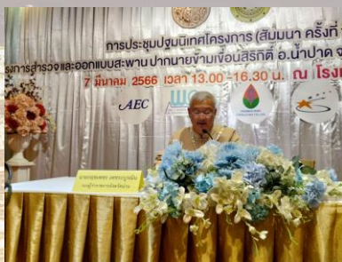
นายกฤษเพชร เพชร-บูรณิน รองผู้ว่าราชการจังหวัดน่าน กล่าวเปิดการประชุม